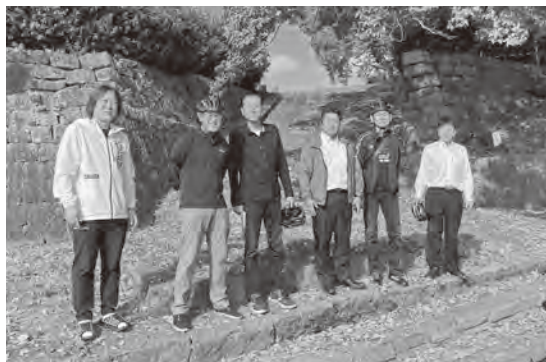
高瀬船着場跡にて