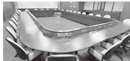
【議員会議室】25名程度