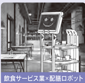
飲食サービス業×配膳ロボット