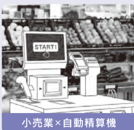
小売業×自動精算機