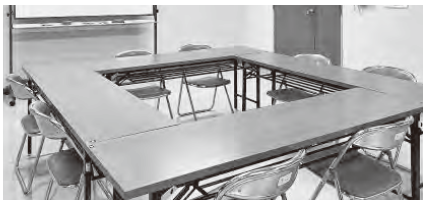
【第1・2会議室】各部屋10名程度

料金の詳細や貸出時間等に関しては当所ホームページに記載しております。ご不明な点は総務課までお気軽にお問い合わせください。