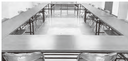
【第1・2会議室連結】15~20名程度