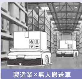
製造業×無人搬送車