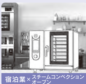
宿泊業×スチームコンベクションオーブン

上記以外の製品カテゴリ 清掃ロボット、券売機、自動チェックイン機、検品・仕分システム、飲料補充ロボット、測量機、丁合機、印刷用紙高積装置など(随時追加される予定)