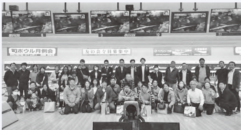
当日参加者の集合写真

令和6年11月18日(月)に、玉名商工会議所「福利厚生の日」として、ボウリング大会を開催いたしました。今年で23回目を迎える本大会では、会員事業所の親睦や職場内の親善を深める事を目的に、45名(15チーム)の皆様にご参加いただきました。各チーム一丸となってハイスコアを目指す様子や、歓声が上がると盛り上がっている様子がうかがえ、終始笑顔の絶えない時間となりました。