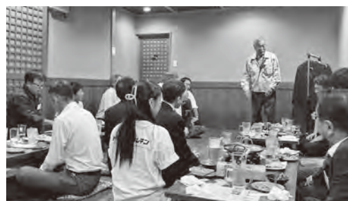
名刺交換会の様子