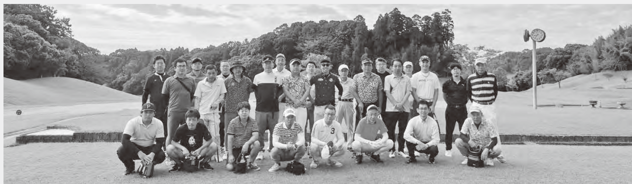
～ 当日参加者の集合写真 ～

10月16日(水)当商工会議所 広報・福祉厚生委員会を幹事として、総務委員会・観光活性化委員会・地域経済活性化委員会の4委員会共催により、会員親睦ゴルフコンペを開催しました。