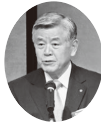
久我会長による 開会挨拶