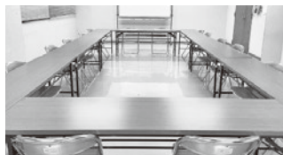
【第1・2会議室連結】15～20名程度