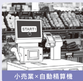
小売業×自動精算機