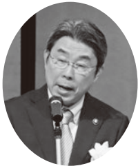
藏原隆浩玉名市長