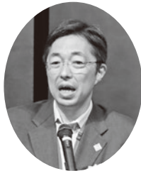
木村敬熊本県知事