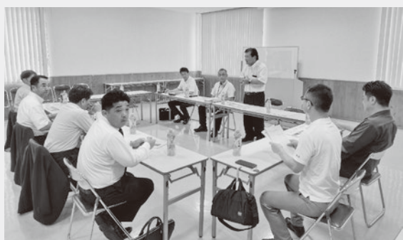
～意見交換会の様子～

玉名商工会議所理財部会では、今後も地域経済の発展に寄与するため、地元企業の声を行政や各種支援機関に届ける取り組みも一層強化していきます。今後の活動にもご期待ください。