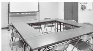
【第1・2会議室】各部屋10名程度

料金の詳細や貸出時間等に関しては当所ホームページに記載しております。ご不明な点は総務課までお気軽にお問い合わせください。