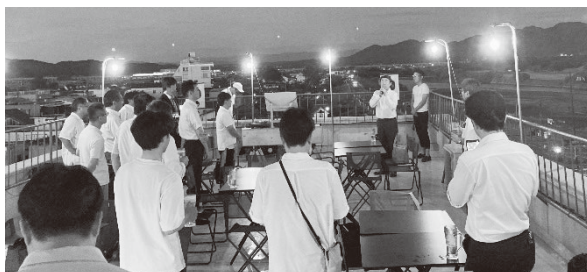
～ HIKE 屋上にて懇親会～