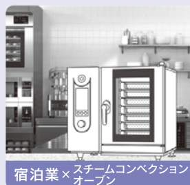
宿泊業×スチームコンベクションオーブン

上記以外の製品カテゴリ | 清掃ロボット、券売機、自動チェックイン機、検品・仕分システム、飲料補充ロボット、測量機、丁合機、印刷用紙高積装置など(随時追加される予定)