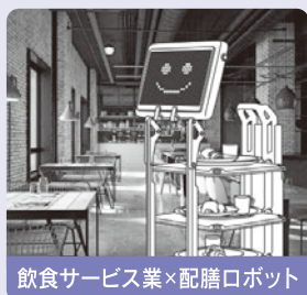
飲食サービス業×配膳ロボット