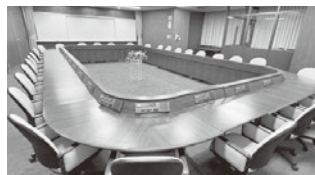
【議員会議室】25名程度