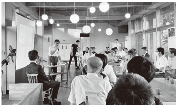
～工藤様による JR 九州のまちづくりについてのご講演～