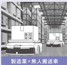
製造業×無人搬送車